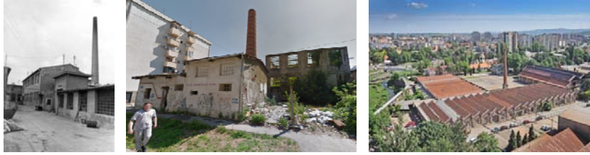
Сликабр. 16, 17 и 18: Приказ комплекса Старе свиларе у Новом Саду и старе ливнице у Крагујевцу