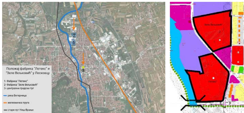
Слике бр. 14 и 15: Положај индустријских комплекса у односу на урбану структуру града (обрада: ЗЗСК Ниш, М. Минић, 2025 Студија заштите); Нацрт Плана генералне регулације 15 – „Летекс“ Лесковцу, предложене намене површина (аутор)

Рекреативне површине и јавни простори – уређено приобаље са пешачким и трим стазама, зелени коридори који повезују комплекс са центром, јавни паркови, тргови и отворени платои за сајмове и манифестације, бицикличке стазе, простори за одмор, игралишта, сеници и урбани мобилијар, интеграција водених и зелених елемената.