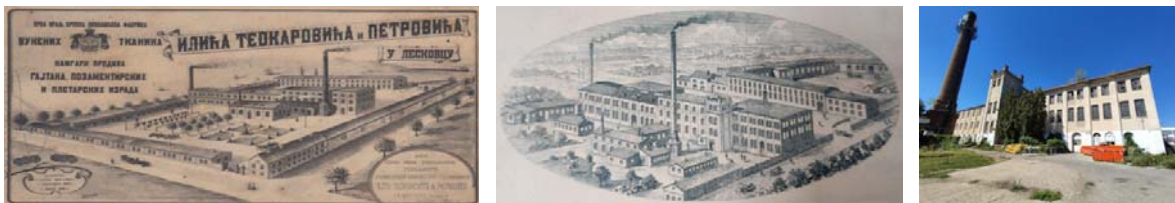
Слике бр. 9, 10 и 11: Изглед фабрике „Старе штофаре“ после 1907. године; изглед комплекса после 1930. године; изглед комплекса 2022. године (обрада: ЗЗСК Ниш, М. Минић, 2025 Студија заштите)

Комплекс „Старе штофаре“ обухвата више објеката различитих периода изградње (1938–1982), укључујући производне хале, предионицу, управне зграде и пратеће објекте, који заједно представљају значајан пример индустријске архитектуре и сведочанство развоја текстилне индустрије у Лесковцу.