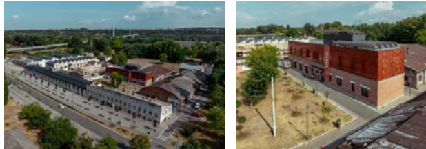
Сликабр. 19 и 20: Приказ комплекса Дистрикта у НовомСаду („Кинеска четврт“)

Датум изградње: 1921. година; стара функција: фабрика жица, ексера, жичане робе, и гвоздена индустрија; Нова функција: креативни дистрикт, културни центар, студији, галерије, кафе, стартап простор; адаптивна поновна употреба (adaptive reuse), конзервација, санација, реконструкција, додавање нових волумена у савременој изведби и материјалима.