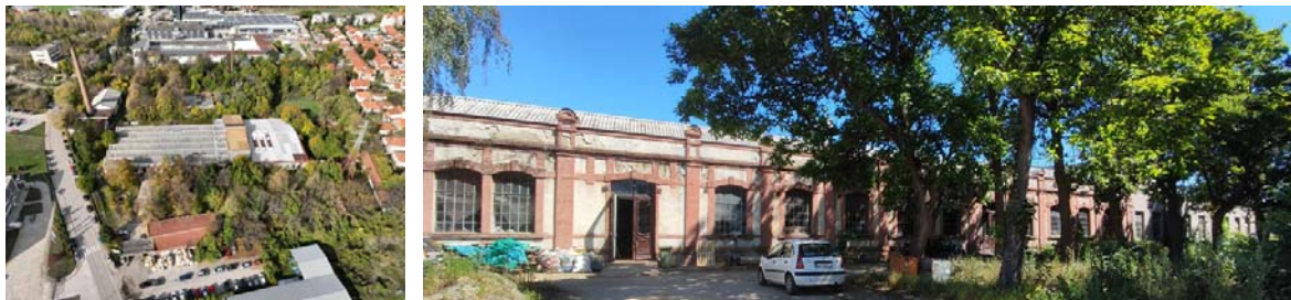
Слике бр. 12 и 13: Приказ комплекса „Зеле Вељковић“

Након Другог светског рата фабрика је конфискована, а производња реорганизована. Назив „Зеле Вељковић“ добија у послератном периоду, када се профилише као значајан произвођач текстилних производа, нарочито предива и трикотаже. Комплекс је током времена претрпео бројне промене услед ратних разарања, реконструкција и доградњи, али су поједини аутентични објекти очувани. Предузеће је 2010. године отишло у стечај, након чега долази до делимичне приватизације и фрагментације комплекса, уз значајне просторне и функционалне трансформације.