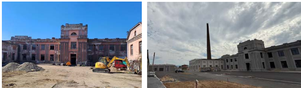
Сликабр. 4 и 5: Фабрика „Ресорт“ пре и после реконструкције

Фабрика "Ресорт" у улици Његошевој, бр. 14 у Лесковцу;