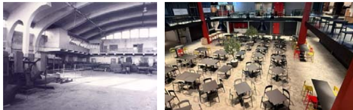
Сликабр. 21 и 22: Приказ Хангара у Београду – некад и сад

Датум изградње: 1920. година; стара функција: хангар за авионе; нова функција: гастро-маркет; адаптивна поновна употреба (adaptive reuse), конзервација, санација, реконструкција.